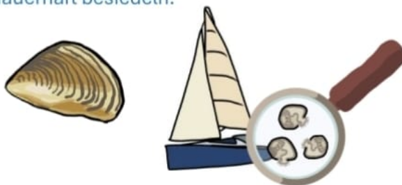
Bild: Erwachsene Muschel und mikroskopisch kleine Larven der Quaggamuschel, die in einem Wassertropfen an einem Bootsrumph haften

Ausbreitungswege: Die Quaggamuschel wird insbesondere über Boote und andere Wassersportgeräte verbreitet. Fatal dabei ist: nicht nur die erwachsenen, bis 4 cm großen Muscheln können verschleppt werden, sondern insbesondere auch befruchtete Eier und Larven . Diese sind mikroskopisch klein und das macht sie so gefährlich: unbemerkt können sie in kleinsten Wassertropfen in neue Gewässer verschleppt werden und diese dauerhaft besiedeln.